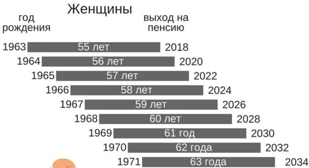
График выхода на пенсию согласно предложенной Правительством Российской Федерации пенсионной реформе: