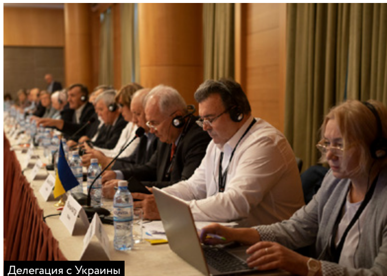
Делегация с Украины

Совет Международной Конфедерации Нефтегазстройпрофсоюзов также приурочил свое заседание к мероприятиям IndustriALL, в работе которого приняли участие представители из России, Азербайджана, Беларуси, Узбекистана и Украины. Заседание было посвящено обсуждению вопросов свободы профсоюзной деятельности и организационного построения профсоюзов в странах