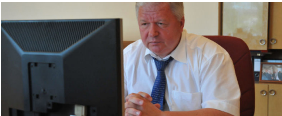
Председатель ФНПР Михаил Викторович Шмаков

В начале октября Федерация Независимых Профсоюзов России проводит интернет-видеоконференцию: «Вопрос для Михаила Шмакова». В ходе прямой линии Председатель ФНПР М.В.Шмаков даст ответы по самому широкому спектру актуальных проблем социальной политики, трудовых отношений, развития профсоюзного движения.