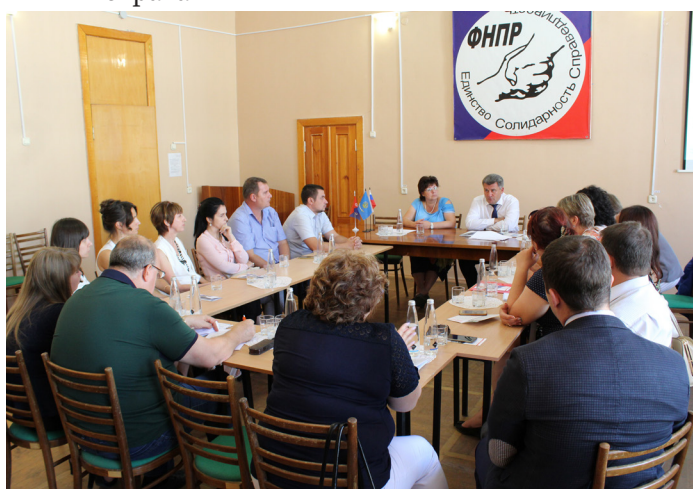
Фото: Круглый стол с представителями профсоюзных организаций Нефтегазстройпрофсоюза России, расположенных на территории Астраханской области