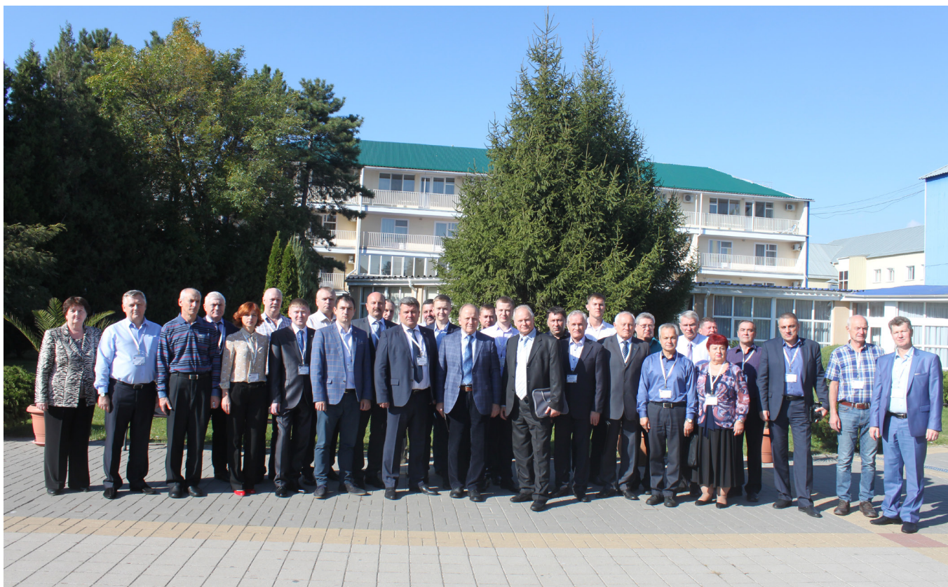
Семинар технических инспекторов труда Профсоюза

«Технические инспекторы труда Профсоюза играют большую роль в деле обеспечения контроля требований охраны труда и промышленной безопасности. Впервые в рамках нашего семинара прошла аттестация по вновь утвержденному порядку привлечения общественных инспекторов в области промышленной безопасности. Это очень знаковое событие для Профсоюза, благодаря которому мы получили допуск на опасные производственные объекты», - отметил Председатель Нефтегазстройпрофсоюза России Александр Корчагин.