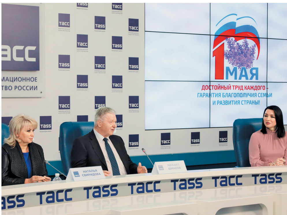
М. Шмаков на пресс-конференции

Главными лозунгами первомайских акций стали: «Работающий человек не должен быть бедным!», «Здоровый работник – счастливая семья!», «Профсоюзы – за единую модель оплаты труда бюджетников», «За рост МРОТ, опережающий инфляцию», «Нацпроект «Кадры» – гарант занятости», «Подготовке кадров для рабочих профессий – поддержку бизнеса и государства», «Растущая экономика – рост зарплат», «Помощь власти – только социальное ответственное работодателем», «Профсоюзы – за прогрессивную шкалу налогообложения», «За нулевой налог на доходы ниже МРОТ!». В рамках акции членские организации ФНПР по всей стране провели массовые мероприятия в различных формах. В регионах: заседания