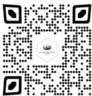
Положение о Конкурсе