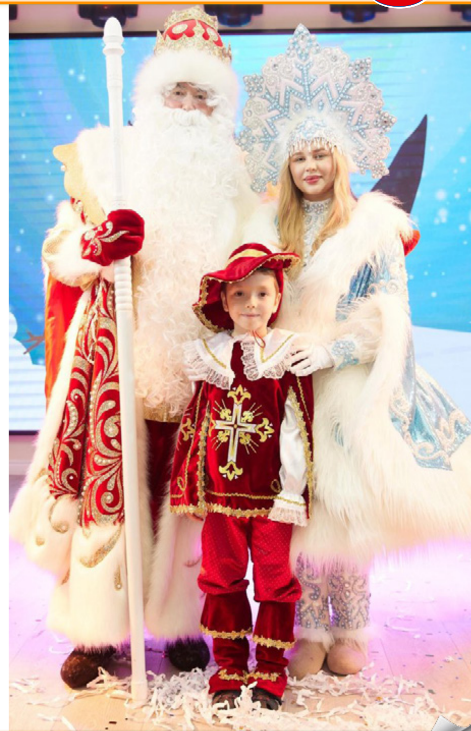
Моя профсоюзная карта