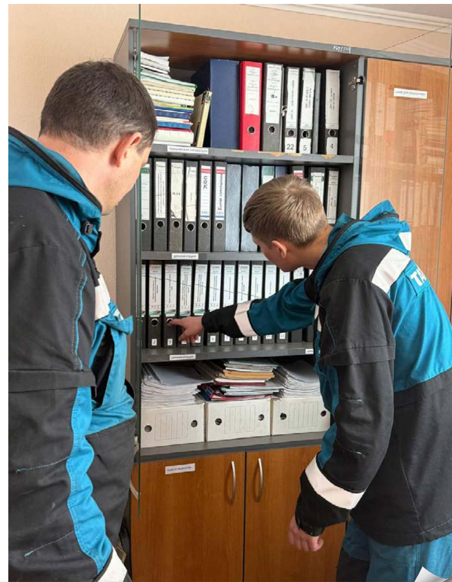
Новости структурных организаций

— Задача профсоюзного комитета состоит в том, чтобы сохранять жизнь и здоровье членов профсоюза, поддерживать позитивный настрой своих работников и обеспечивать их благополучное возвращение домой. Для достижения этой цели мы сосредоточены на создании безопас-