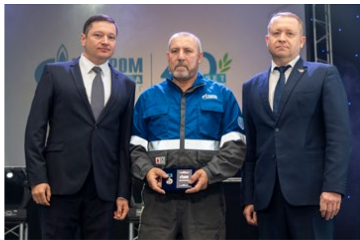
Новости структурных организаций