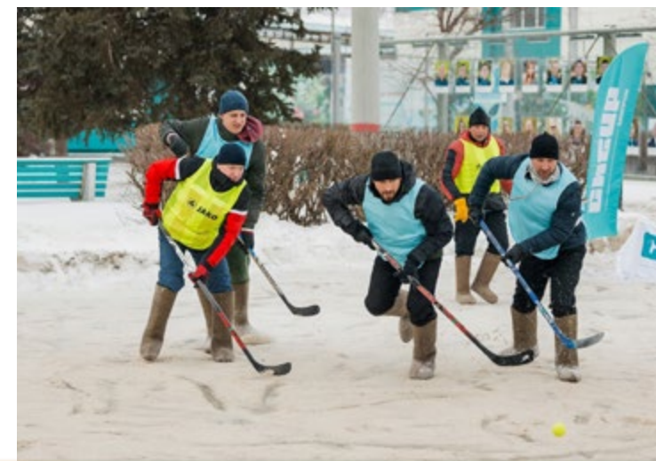
Моя профсоюзная карта