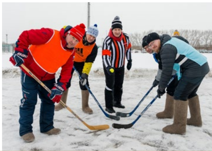
Новости структурных организаций