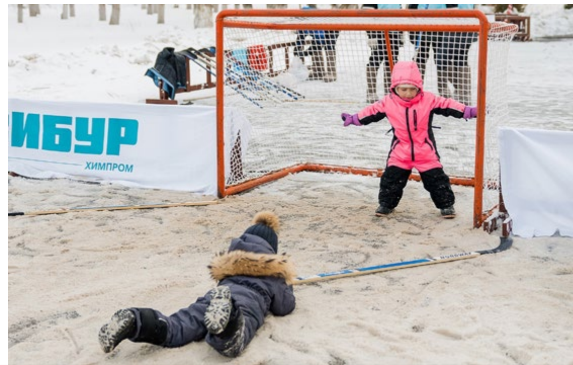
Новости структурных организаций